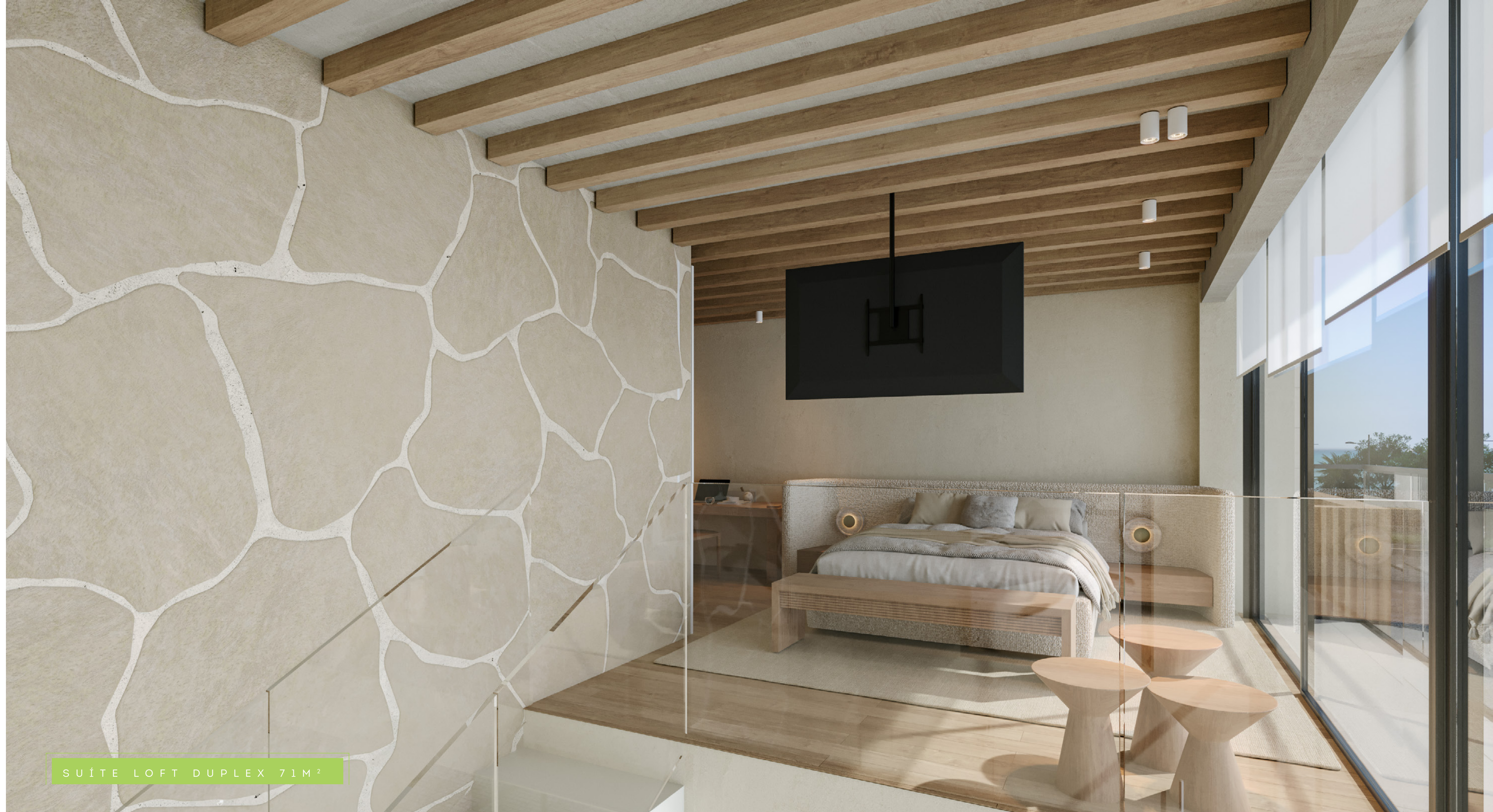
SUÍTE LOFT DUPLEX 71M 2