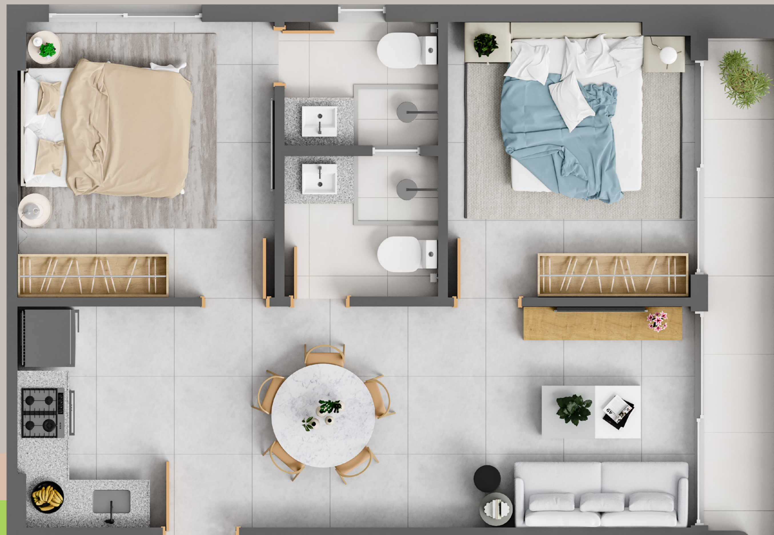
PLANTA APARTAMENTO-TIPO - 53M 2