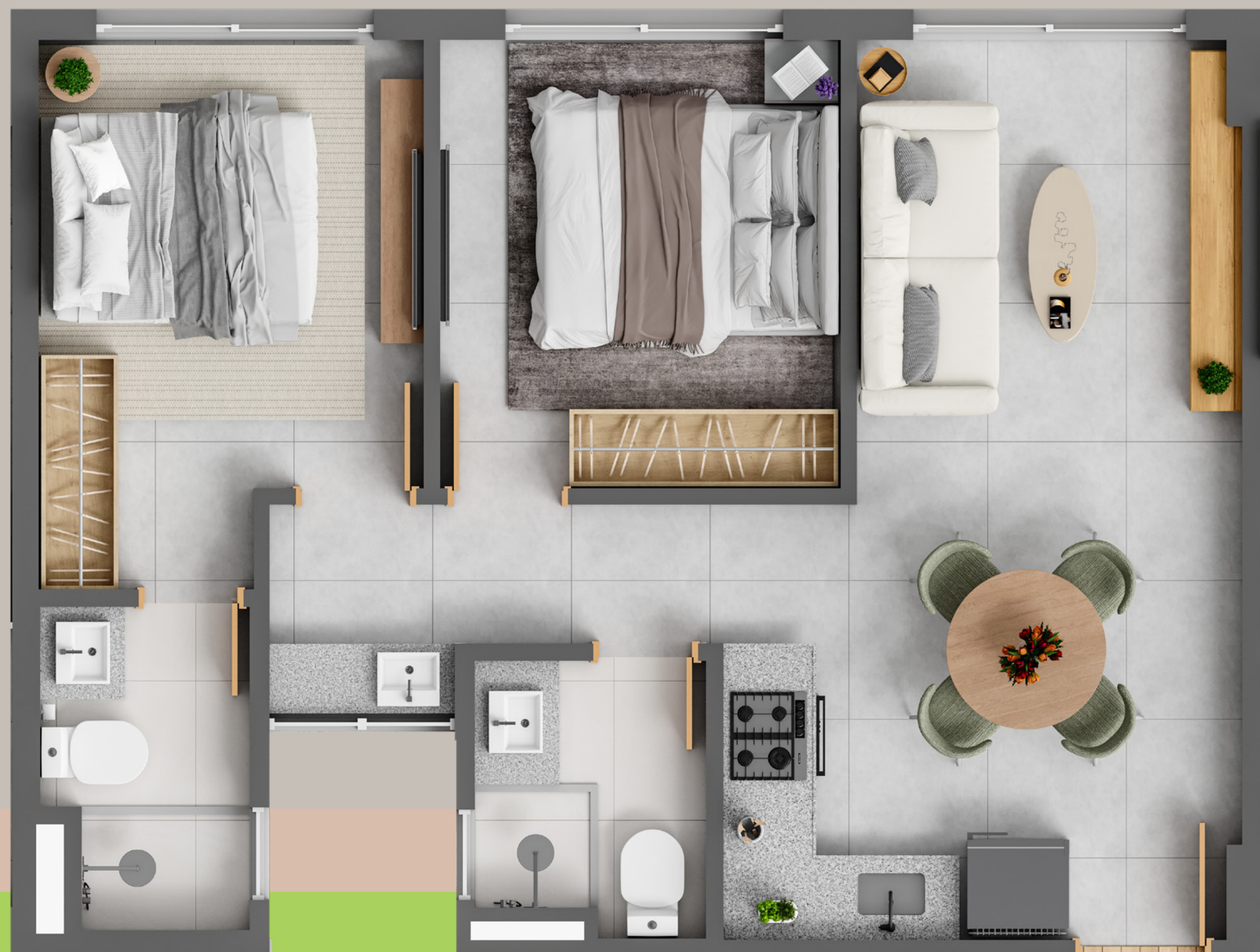
PLANTA APARTAMENTO-TIPO - 49M 2