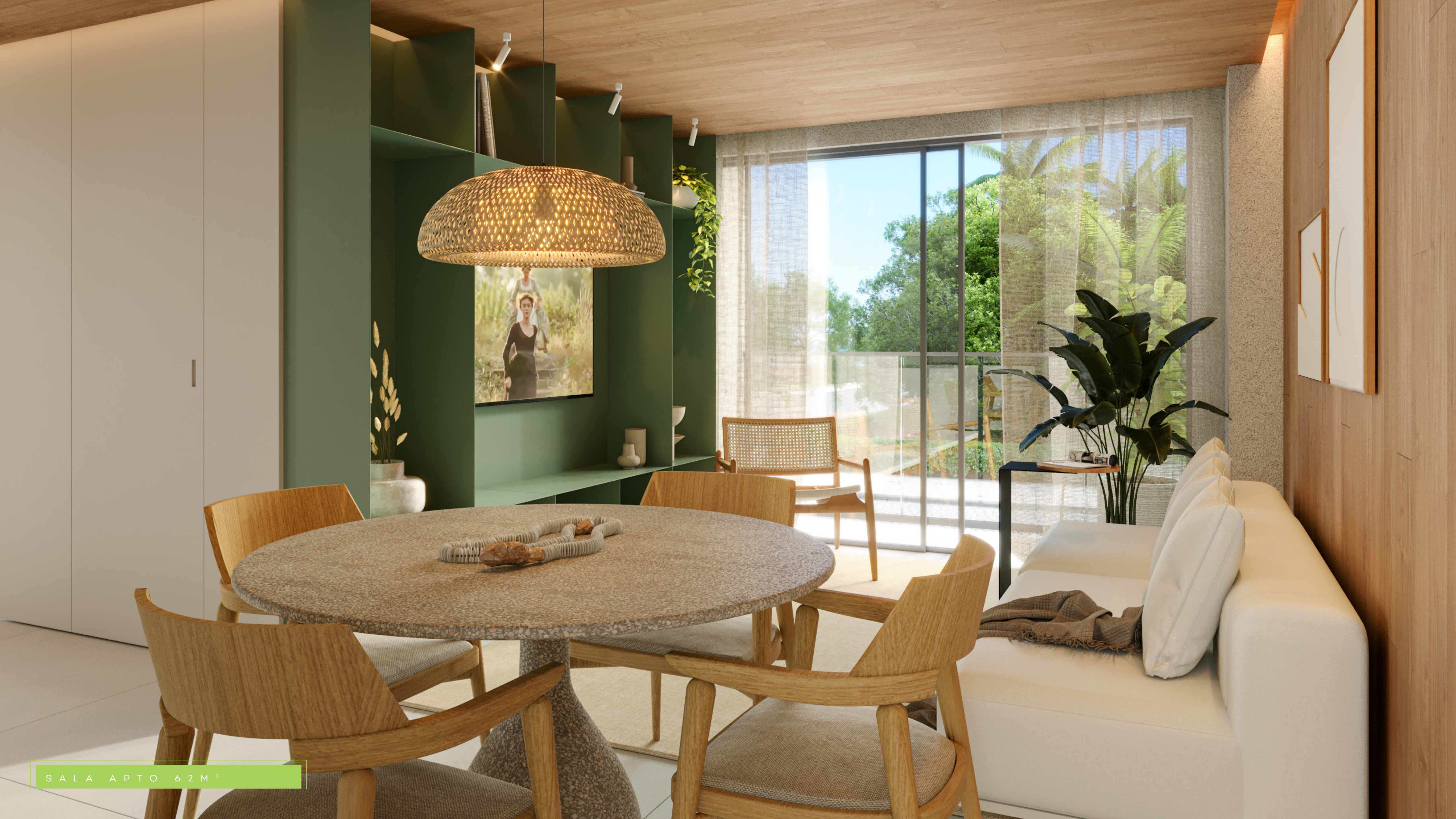
SALA APTO 62M 2