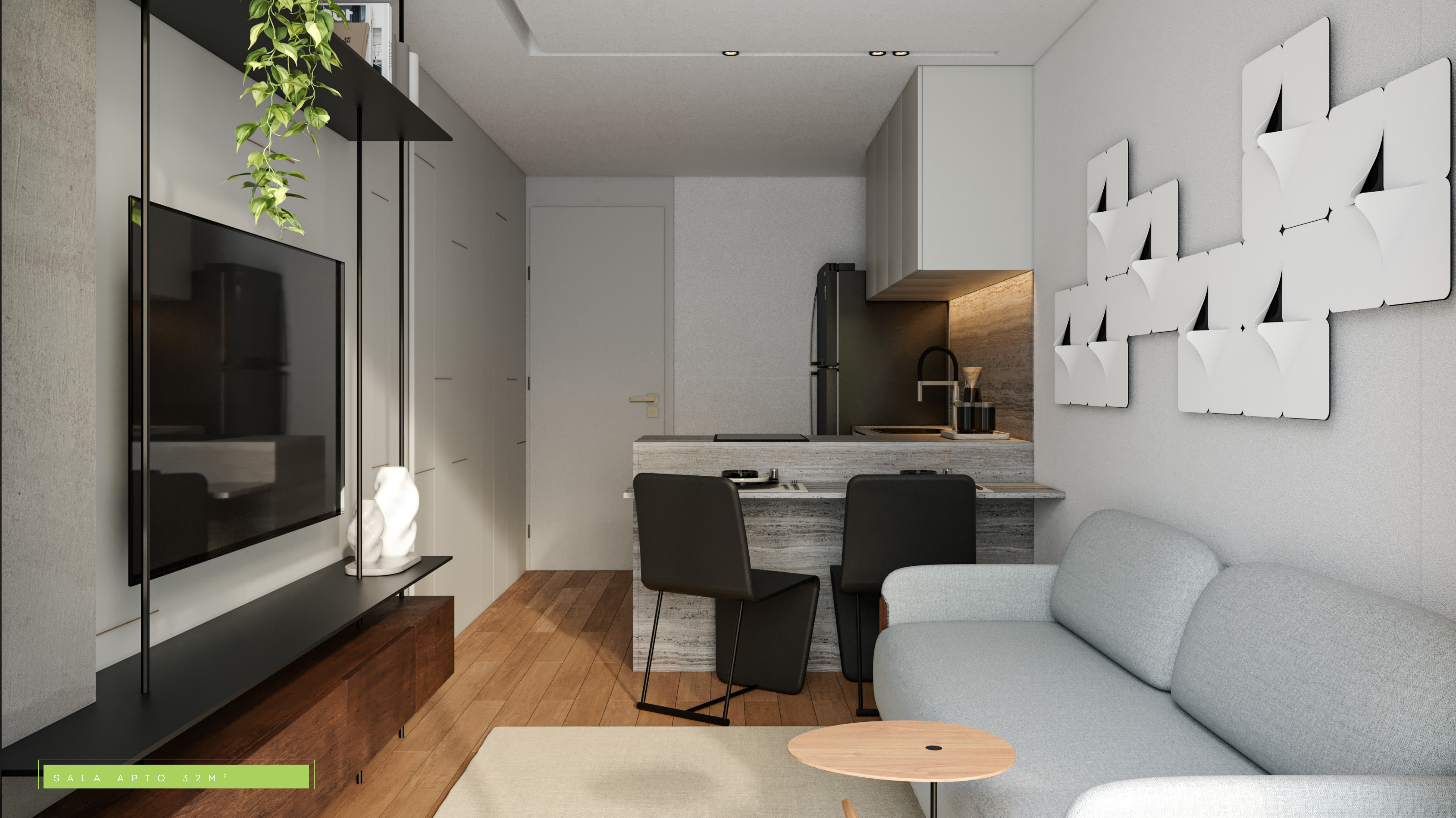
SALA APTO 32 M 2