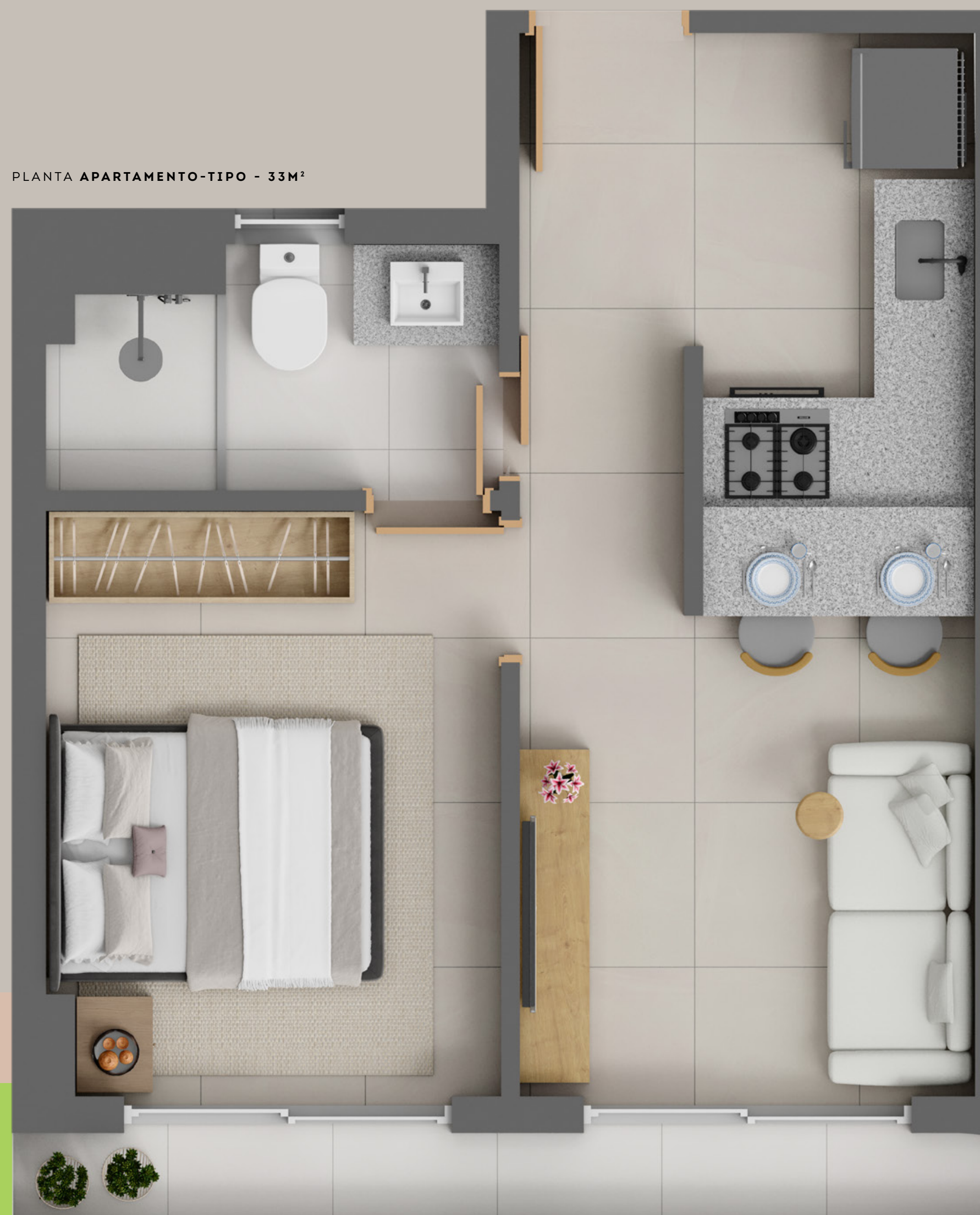
PLANTA APARTAMENTO-TIPO - 33M 2