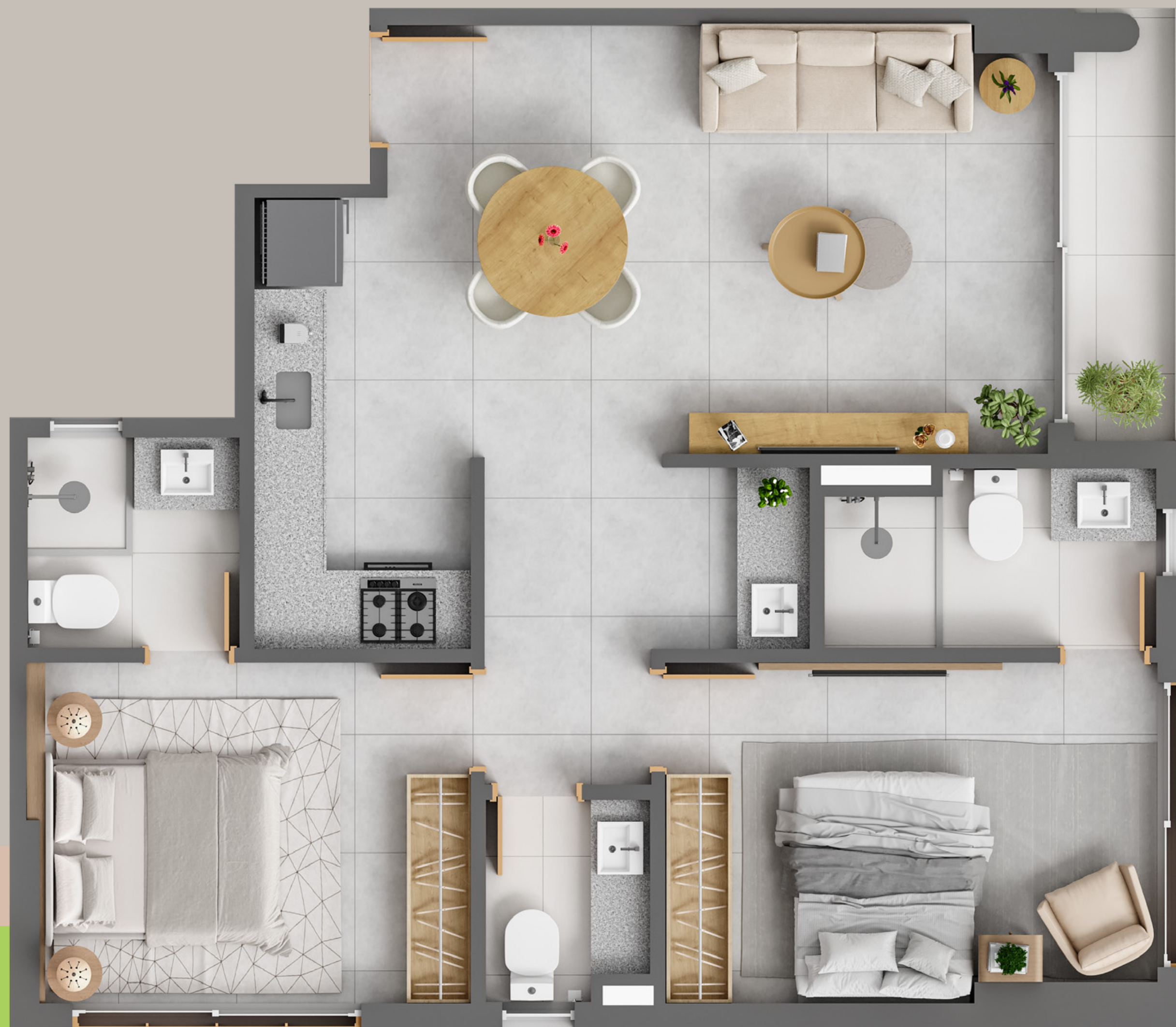
PLANTA APARTAMENTO-TIPO - 61M 2